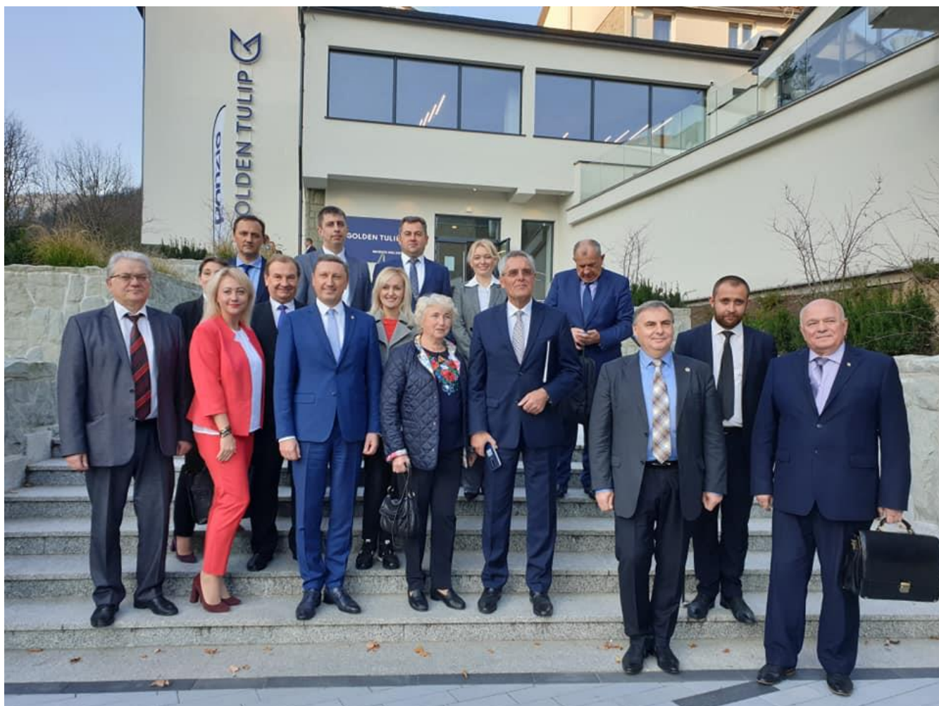
Інформаційний відділ Луцького НТУ

Разом з тим, ректори обговорили реалізацію концепції «трикутника знань» (освіта-наука-інноватика) в технічних університетах Польщі та України; європейське мережування старт-ап шкіл та формування спільних інноваційних середовищ; міжнародне українсько-польське співробітництво в європейському дослідницькому просторі; досвід використання ефективних механізмів спільного залучення вчених університетів України і Польщі до європейських дослідницьких програм; сприяння розвитку лідерських навичок серед студентів Польщі та України на сучасному етапі – з особливим акцентом на ролі студенток (гендерний акцент).